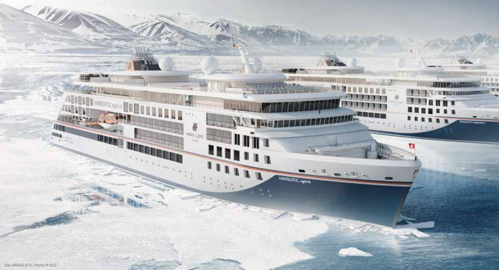
Die HANSEATIC Flotte