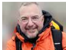
Patrick Rohr Fotograf, Journalist & Moderator