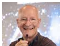
Claude Nicollier Astronaut & Astrophysiker